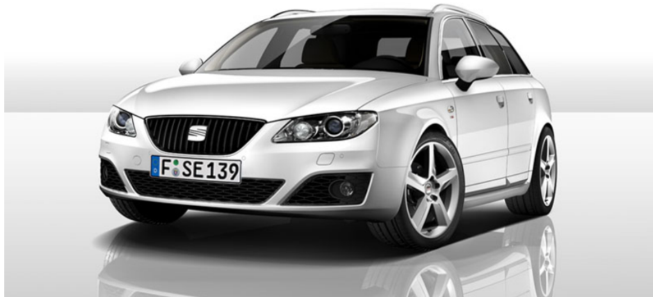
Bild dient nur zur Illustration und zeigt Sonderausstattungen gegen Mehrpreis